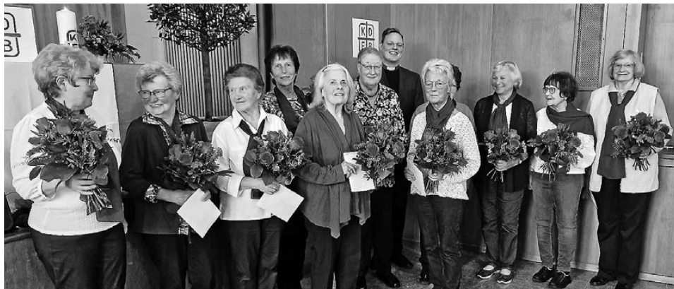
Die geehrten Gründungsmitglieder