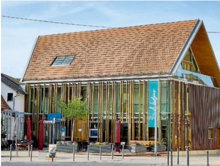
Nadjas Restaurant