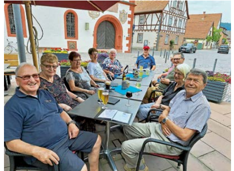
KAB bei Nadjas

Jetzt fürs Freudenberg-Amtsblatt-Update anmelden und keine Ausgabe mehr verpassen!