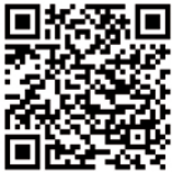
QR-Code zur MOQO-App

Sie nutzen dafür die kostenlose MOQO-App . Sie können sie im App Store oder bei Google Play herunterladen. Auf dem Fahrzeug selbst finden Sie auch einen QR-Code, der Sie direkt zur Buchung führt. Mit der App können Sie das Auto öffnen, die Fahrt beenden und Ihre Buchungen verwalten. Ohne die App ist eine Nutzung leider nicht möglich.