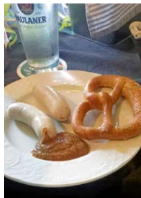
Weißwurst mit Bretzel