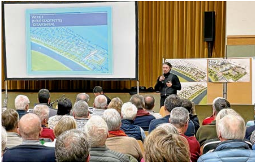
Öffentlichkeitsveranstaltung zur Revitalisierung des ehemaligen Rauch-Werkes